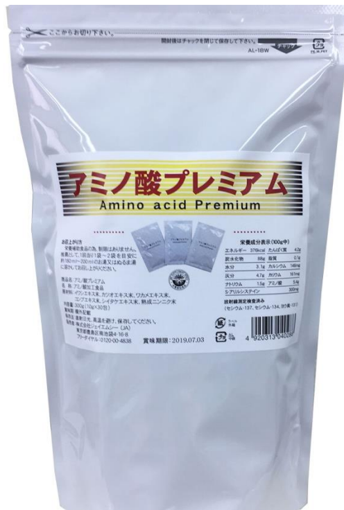
300g (10g×30包) /袋