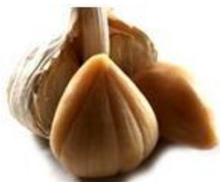
低温发酵熟成大蒜 ↑

□. 大蒜是烹调美味佳肴过程中的调味品，也是上好的营养品，更是有益身体健康极佳的绿色天然药食品。有研究显示大蒜的营养价值甚至超过了人参。大蒜含有 200 多种有益于身体健康的物质，除蛋白质，维生素 E, C 及钙，铁，硒等微量元素外，最受人们关注的是具有增强人体免疫力的 S-烯丙基半胱氨酸(SAC)，以及极具杀菌力的大蒜素。另外一些成分还能预防循环系统的一些疾病，如稳定血压，改善血液循环，抑制血小板聚集，防止血栓形成，调整糖代谢等。因此，大蒜不仅是食物烹调过程中必备的珍品，更是人们日常生活过程中防治疾病的重要手段。1990 年美国国家癌症研究所 (NCI) 的【癌症预防可能性高的食品】中，大蒜排在首位。