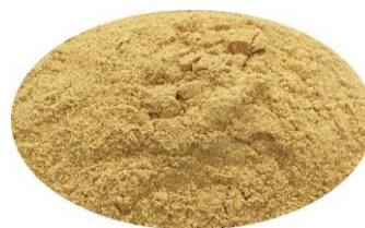
低温发酵熟成蒜粉 (AGP) ↑